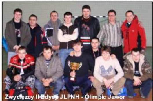
Zwycięzcy II edycji JLPNH - Olimpic Jawor