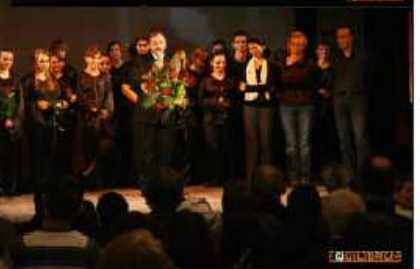
przełomie marca i kwietnia. Prezentujemy słowa dwóch utworów, mając nadzieję, że ich treść zachęci do obejrzenia musicalu tych z Państwa, którzy nie mogli uczestniczyć w premierze.